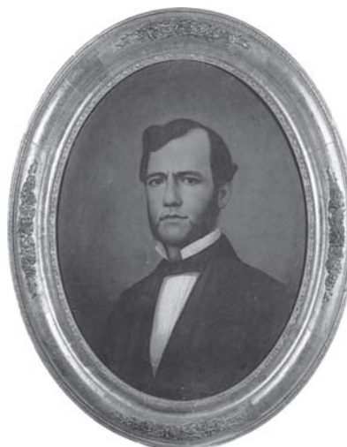
Figura 2. Doutor Otto Edward Henry Wucherer.